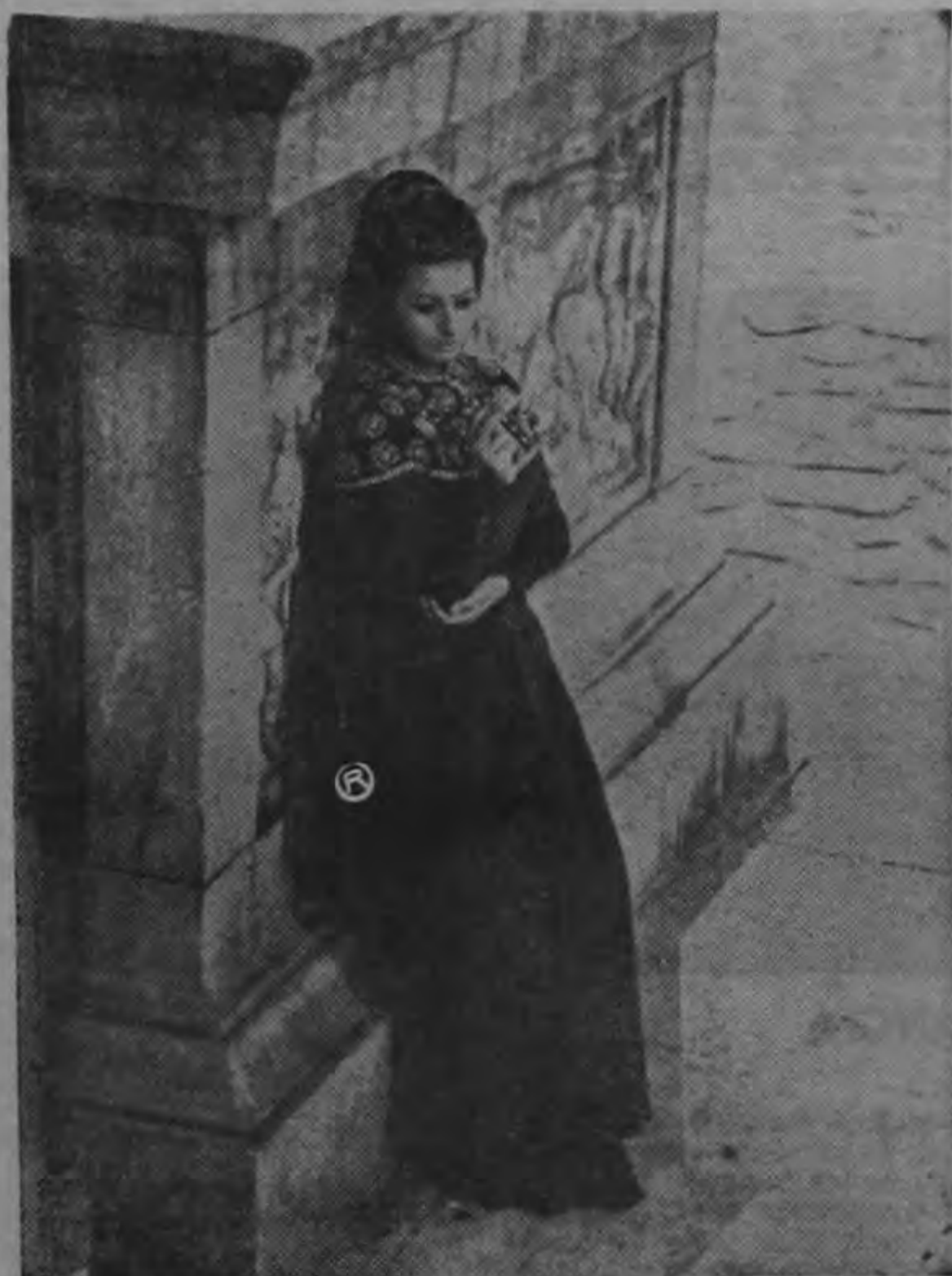
SOFIA QUIERE SER COSMONAUTA. La actriz cinematográfica Sofia Loren, hija del Emperador Marco Aurelio (Alec Guinness) en la película que se rueda en España "La Caída del Imperio Romano", medita en una de las escenas, tomada junto a las viejas columnas del Foro. Puede que ante ese decorado, las ideas de la artista napolitana resulten un poco anacrónicas. Porque, lo que ella quiere, según ha manifestado antes de marchar a Moscú, es que le ofrezcan una plaza en un vehículo espacial. Puede que sea pura propaganda. Lo malo es que le acepten la demanda.

Claudia Cardinale, Martine Carol, Leslie Caron, Pierre Mondy, Vittorio de Sica, Jean Marais, Rossano Brazzi y Orson Welles figuran en el reparto.