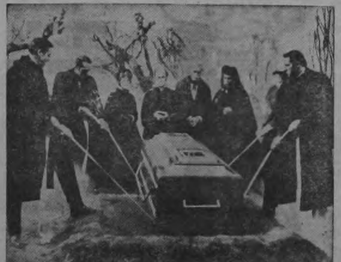
Los dolientes familiares contemplan el sepelio de el actor Ray Milland, en la gran película en colores y CinemaScope de la obra clásica de terror de Edgar Allan Poe.