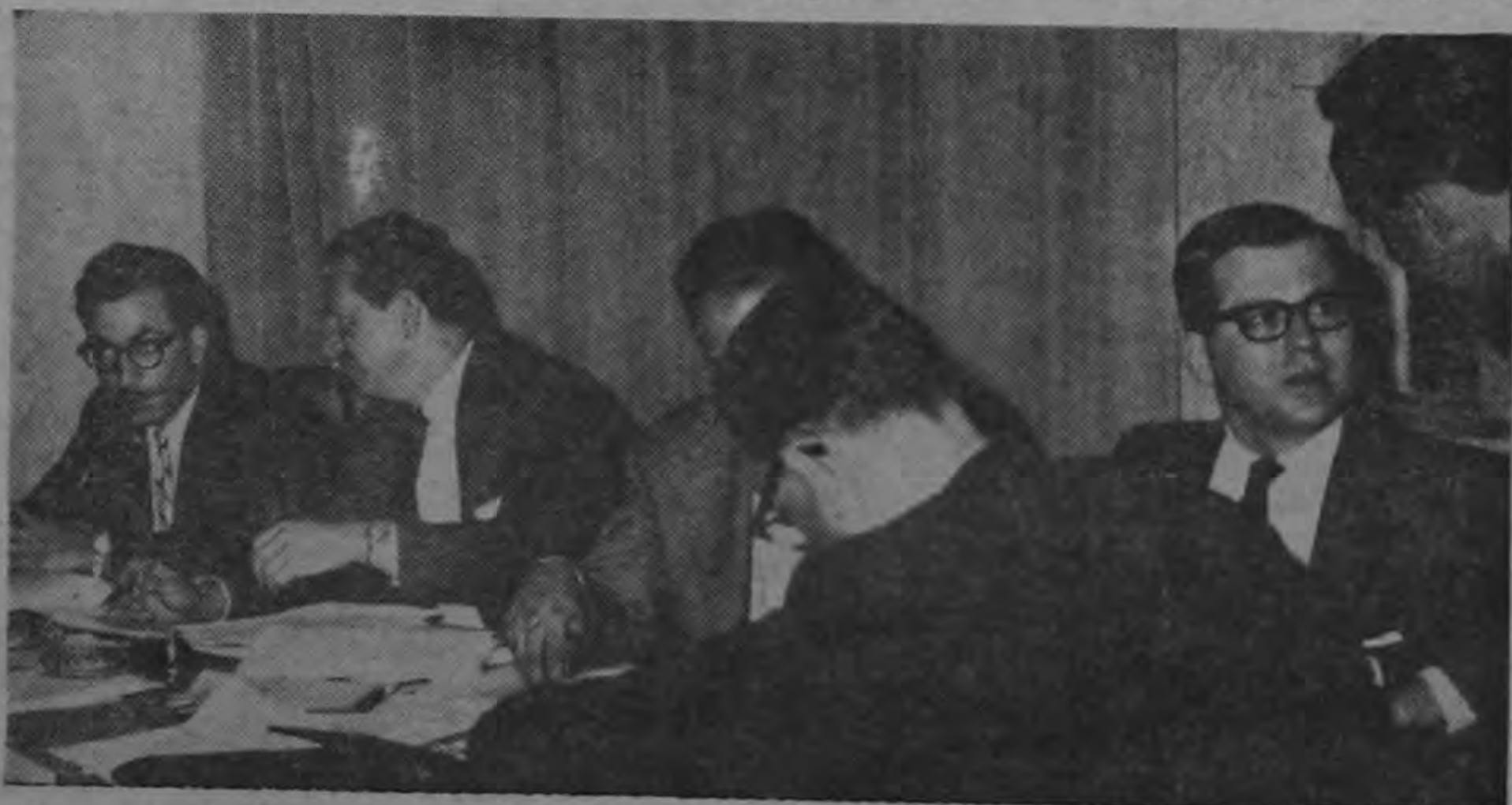
En la Segunda Comisión de las sesiones del CIES que considera los problemas de Desarrollo Agrícola y Reforma Agraria, los representantes de Chile, Costa Rica, Paraguay, Venezuela, la República Dominicana, México y Argentina completaron sus exposiciones sobre la situación agrícola en sus respectivos países.

Será situación plantean Junta Progresistas y vecinos de Río Jiménez de Pococí al Sr. Presidente, exponiendo que en distintas ocasiones Instituciones del Estado envían delegados pero las realizaciones materiales de sus problemas nunca llegan. "Encintramos que no es justo ni aceptable que se nos trate como si no fuéramos parte integral de la economía y la sociedad costarricense". — TEXTO EN PAGINA 5 —