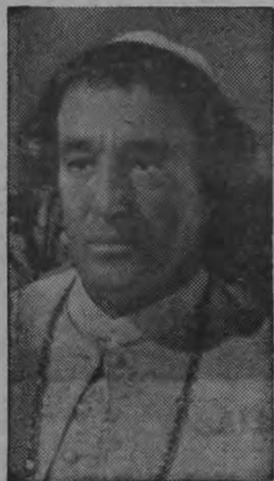
VITTORIO DE SICA

El momento culminante de la carrera asombrosa de Napoleón Bonaparte, su triunfo en la batalla de Austerlitz contra los ejércitos conjuntos de Austria y Rusia Zarista, es el tema de la monumental producción CinemaScope en colores, HISTORIA ESCRITA CON SANGRE de la 20th Century-Fox.