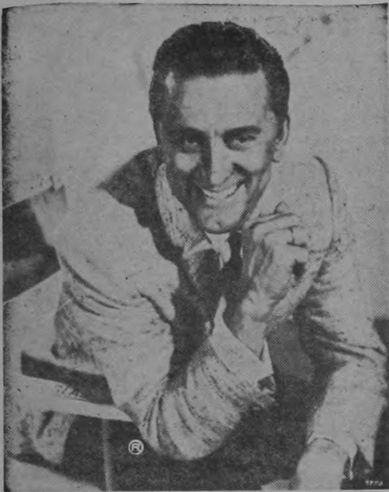
Kirk Douglas... el éxito lo complica todo...