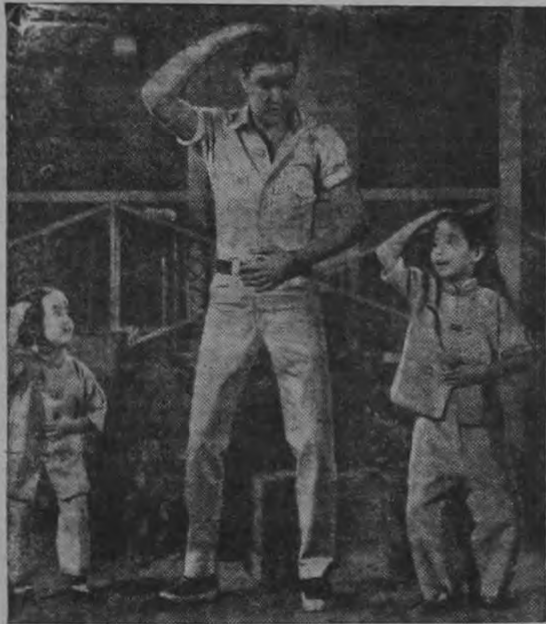
ELVIS PRESLEY, en simpática escena de la película CHICAS, CHICAS y MAS CHICAS, en que le vemos cantando y bailando con dos pequeñas niñas orientales.