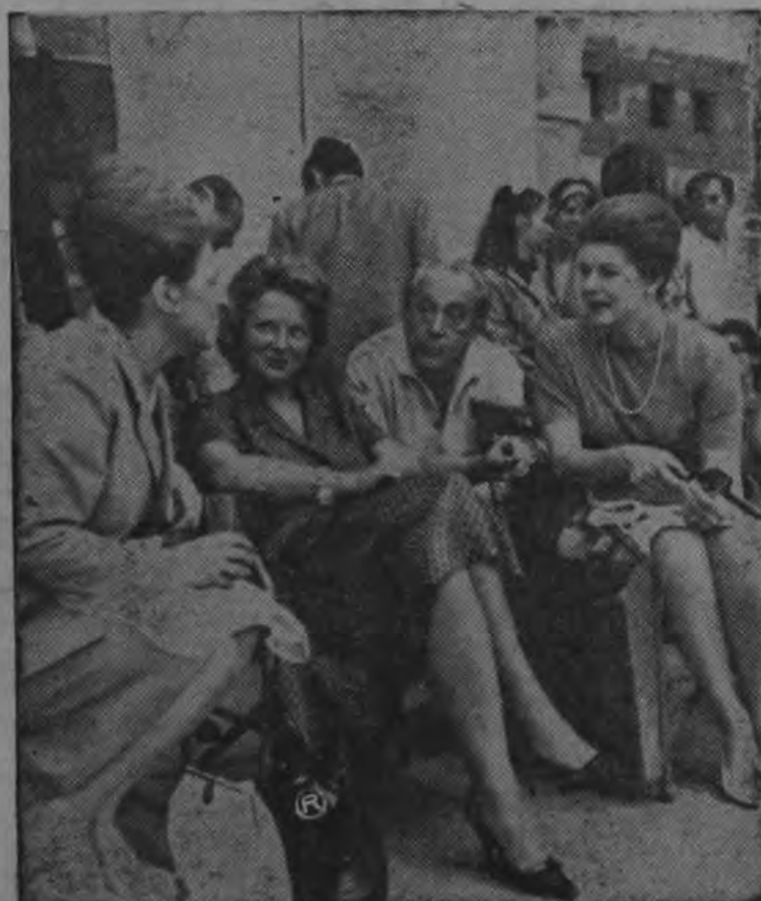
LA PRINCESA IRENE DE HOLANDA. En la foto, aparece la graciosa princesa Irene, de los Países Bajos, mientras contempla el rodaje de unas escenas de la película "La caída del Imperio Romano", en las cercanías de Madrid. (Foto Inter American Press Agency).

aquí en clubes sociales, debido a su alto costo de presentación. La Creadora del estilo Monna Bell, y de su interpretación el Telegrama será un cañonazo artístico.